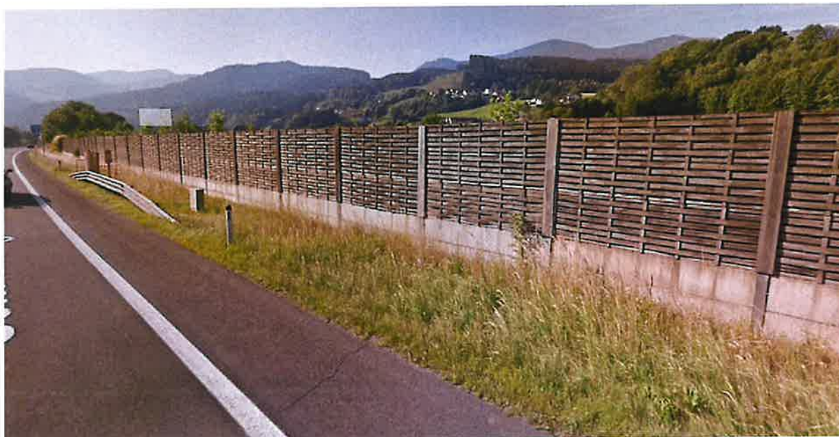
Ansicht von der S6 Semmering Schnellstraße

Aufgrund der topografischen Gegebenheiten (höherliegendes Plateau im Süden bzw. Westen) und der angrenzenden S6 mit Lärmschutzwand im Norden ist das Planungsgebiet von außen nur aus östlicher Richtung einsehbar. In diesem Bereich sind bereits Einzelbäume bzw. Sträucher vorhanden, welche bereits jetzt diesen Standort teilweise visuell abschirmen.