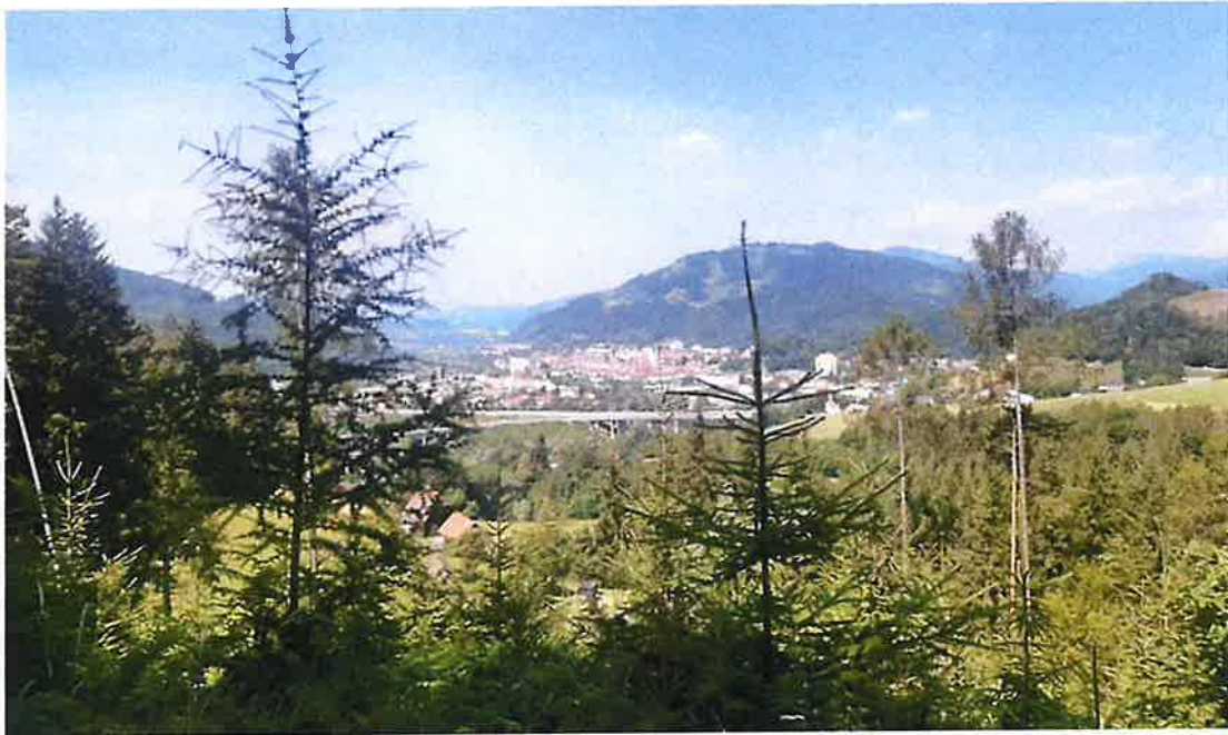
Blick Richtung Stadtzentrum: Quelle: Stadtgemeinde Bruck an der Mur

Vom Projektstandort ist eine Sichtbeziehung zum Stadtzentrum von Bruck an der Mur gegeben und liegt für den geplanten Standort somit eine besondere Standortgunst vor.