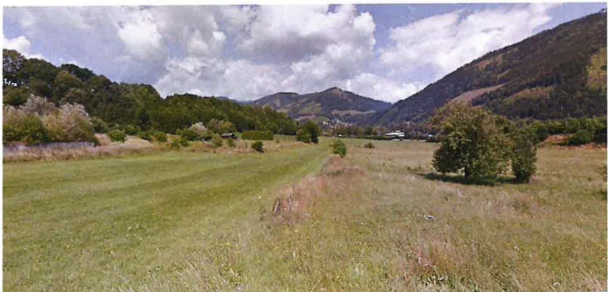
Ansicht des Planungsgebietes aus östlicher Richtung

Das gegenständliche Planungsgebiet befindet sich unmittelbar südlich der S6 Semmering Schnellstraße bzw. der ÖBB-Bahnstrecke Bruck an der Mur - Leoben. Das Planungsgebiet ist nahezu eben. Südlich des Planungsgebietes beginnt eine steile, bewaldete Hangzone des dahinterliegenden großflächigen und höher liegenden Plateaus, welches im Westen bis zur S6 reicht. Entlang der S6 Semmering Schnellstraße ist eine durchgehende Lärmschutzwand vorhanden und ist somit der geplante Standort von der S6 aus nahezu nicht einsehbar.