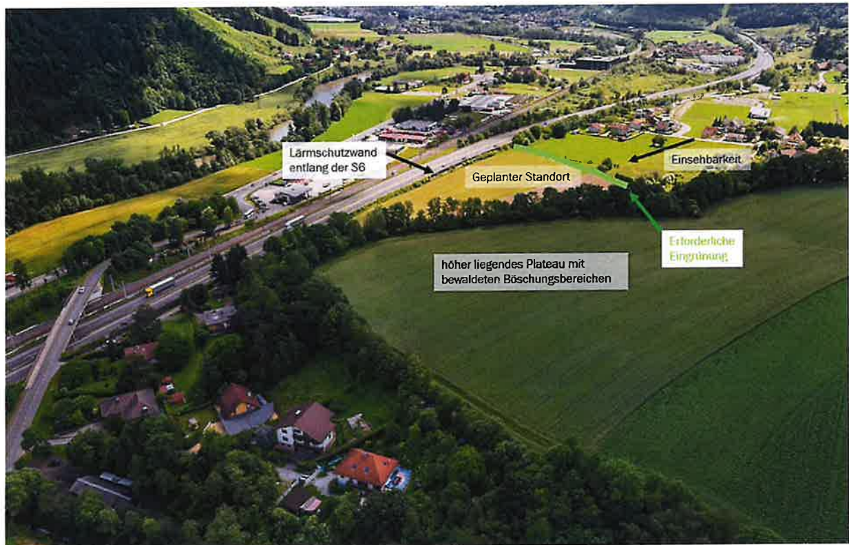
Schrägluftbildaufnahme des geplanten Standortes und des Umgebungsbereiches

Das gegenständliche Planungsgebiet befindet sich unmittelbar südlich der S6 Semmering Schnellstraße bzw. der ÖBB-Bahnstrecke Bruck an der Mur - Leoben. Das Planungsgebiet ist nahezu eben. Südlich des Planungsgebietes beginnt eine steile, bewaldete Hangzone des dahinterliegenden großflächigen und höher liegenden Plateaus, welches im Westen bis zur S6 reicht. Entlang der S6 Semmering Schnellstraße ist eine durchgehende Lärmschutzwand vorhanden und ist somit der geplante Standort von der S6 aus nahezu nicht einsehbar.